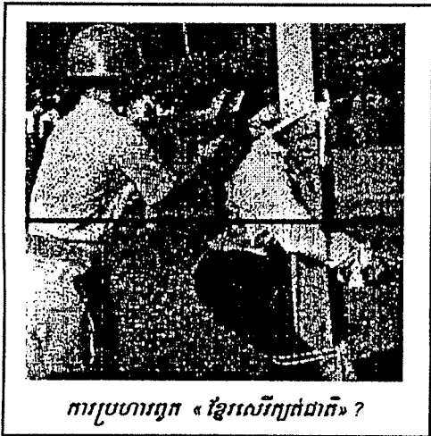
ការប្រហារពួក « ខ្មែរសេរីក្បត់ជាតិ » ?

រាជរដ្ឋាភិបាលធ្វើយ៉ាងនេះខុសធ្ងន់ណាស់ ដោយមិនបាន កាន់យកនូវពាក្យសច្ចៈ ហើយបែរជាទៅចោកប្រាសគេ យកមក សម្លាប់ដោយខ្លះការពិចារណា ។ ធ្វើយ៉ាងនេះមិនខុសអ្វីពីពួក ប៉ុល.ពត ឡើយក្នុងគ្រានោះ ។